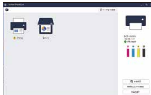
画像② パソコン画面

※画像①のように残量表示が「？」と表示されておりますが、使用の過程ではインク残量はわかりません。LC411/LC412 は特許の問題のせいで残量表示できませんが、画像②のようにパソコン側では残量メーターが減って残量が確認可能です。しかし、ドライバーが最新ではない場合、完全版をインストールを行っていない場合は確認することができない場合がございますので完全版のインストールをお願い致します。